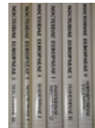
Imagen de portada: Vista parcial de los lomos de algunos volúmenes de la serie Noctuidae Europaeae .