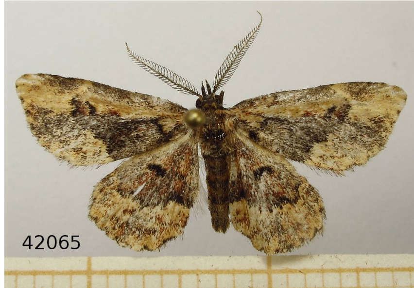
Figura 1: Habitus de Parascotia nissenii Turati, 1905 ♂, LOU-Arthr 42065.

Fibiger et al. (2010[3]), la consideran bivoltina con los imagos en una primera generación en mayo-junio y otra de mediados de agosto a octubre. Sin embargo, aunque he visitado la zona de captura en varias ocasiones para colocar la trampa luminosa, (algunas de ellas fueron el, 28/08/2008, 18/10/2008, 27/08/2010, 06/05/2011, 04/07/2014, 30/08/2014, 27/09/2014, precisamente en los momentos idóneos para que hubiese acudido a esta), nunca apareció, hasta