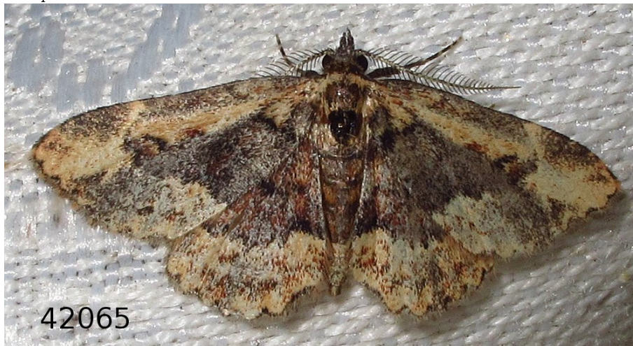
Figura 2: Ejemplar de Parascotia nisseni , LOU-Arthr 42065, recién llegado a la trampa luminosa.

La especie P. nisseni habita, pues, una escasísima formación termófila de un carácter muy específico en Galicia por no estar sobre calizas. Y tanto en Feces de Cima como en los cercanos Monterrei, Oímbra, Verín o en la ladera de A Veiga das Meas de Vilardevós (facies Quercetum suberis ), el bosque dominante es ya un Genisto falcatae-Quercetum pyrenaicae , y solo en escasos lugares pervive algún encinar relicto, un Genisto hystricis-Quercetum rotundifoliae , como el de Feces de Cima, además con exigua superficie y bastante deteriorado que representaría el óptimo vegetacional para P. nisseni .