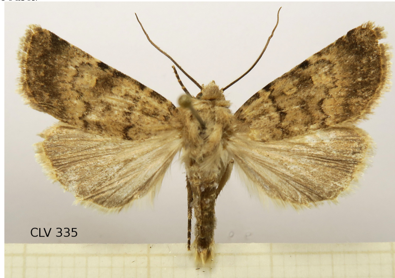
Figure 1: Habitus de Chersotis fimbriola (Esper, [1803]), ♂, CLV335, de Folgoso do Courel.

En cuanto a las plantas nutricias, se han mencionado diferentes plantas bajas a lo largo de su distribución; en el Courel se han publicado u observado, entre otras, Echium vulgare (LOU 29909!, Camaño et al. , 2006: 58 [2]); E. plantagineum (LOU 26715!, Camaño et al. , 2006: 58 [2]). Plantago subulata (Merino, 1906: 244 [8]); P. lanceolata var. dubia (Giménez de Azcárate & Amigo, 1996: 112 [5]); P. holosteam (FGV 6109 [=LOU 47358]). Anemone nemorosa (LOU 30756, Pino et al. , 2008: 27 [10]).